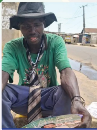
RAFAI LEGGE LA RIVISTA