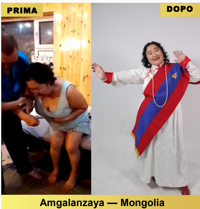
Amgalanzaya — Mongolia

Herald efficaci: tutti sono ambasciatori. Attraverso la